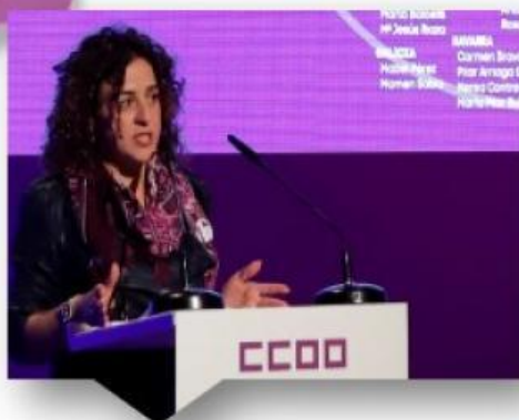
ELENA BLASCO MARTÍN SECRETARIA CONFEDERAL DE MUJERES E IGUALDAD DE CCOO

Y vamos a seguir impulsando políticas de igualdad y medidas específicas para acabar con las desigualdades estructurales de género, porque queremos igualdad en el empleo y conciliación corresponsable en la responsabilidad de cuidados.